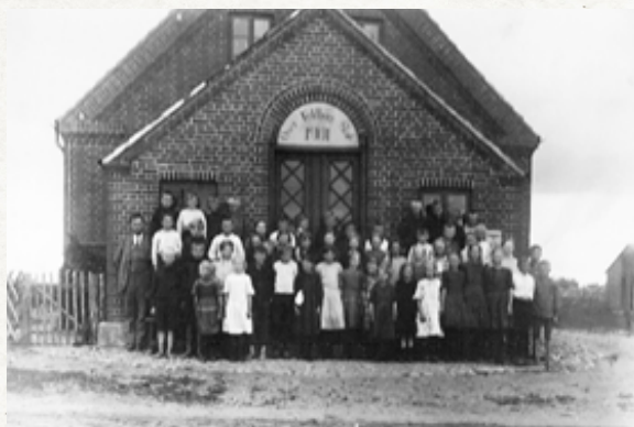
En skole som dem, danske udvandrere byggede i Argentina

Mange af de danskere, der tager til Argentina, bosætter sig i og omkring byen Tandil, der ligger ca. 300 km. sydøst for hovedstaden, Buenos Aires. I Tandil bygger udvandrerne danske kirker og skoler og opretter danske idrætsforeninger. De gør alt, hvad de kan, for at bevare den danske kultur. De gifter sig med hinanden og blander sig ikke med resten af det argentinske samfund.