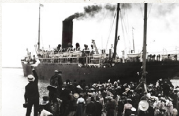
Et skib, der forlader Danmark, mens venner og familie vinker farvel på kajen

Langt størstedelen af udvandrerne tilhører den fattige underklasse på landet. De er husmænd, der ejer meget lidt eller ingen jord, tjenestefolk eller fæstebønder, som ikke ejer men lejer et stykke jord af godsejerne. Udvandrerne rejser ud i verden med drømmen om at skabe sig et bedre liv. De fleste af de danske udvandrere tager til USA eller Canada, men ca. 13.000 tager til Argentina ligesom oldefaren i Tango.