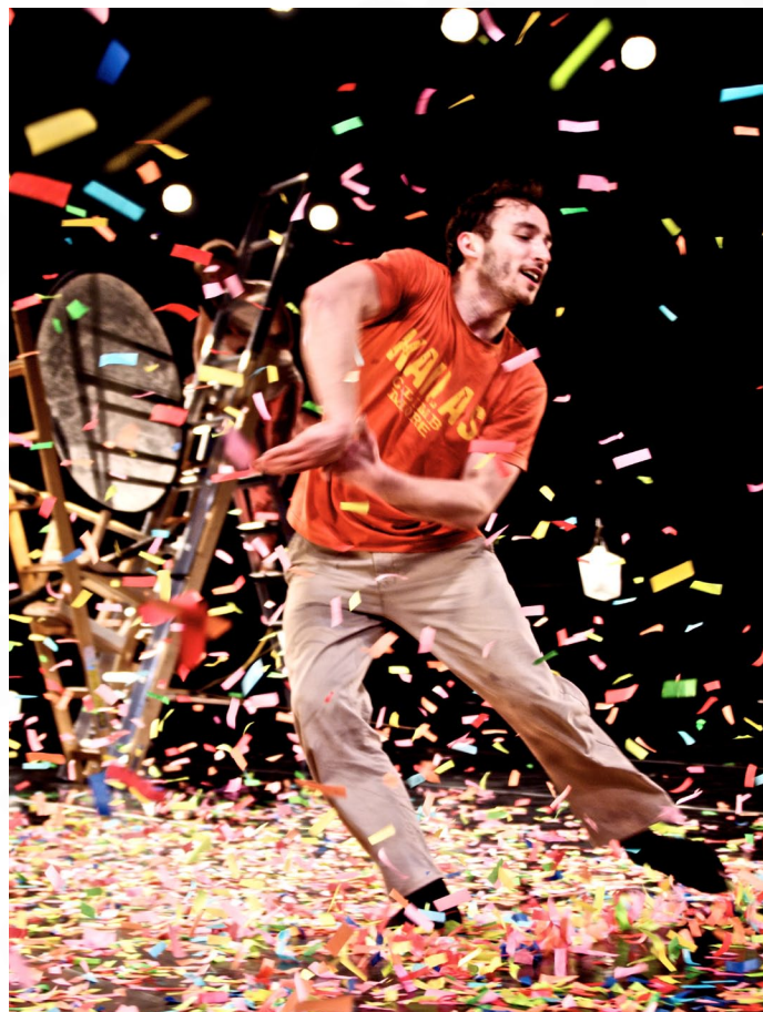
Mute Comp., Conspiracy of Spring, efterår 2014.

De fleste danseforestillinger er ikke bare ren trindans. Scenekunstgenrerne blander sig sammen, og næsten alle forestillinger på Bora Bora indeholder elementer af performance og teater. Brug fx vores forestillinger til at vise bredden i teatergenren, og hvordan det postmoderne teater bruger en ikke-narrativ fortælle teknik og visuelle virkemidler i deres formidling.