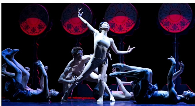
Dansk Danseteater, Stormen, forår 2014.

Meget af musikken til Bora Boras forestillinger er komponeret til selve forestillingen. I mange forestillinger spiller musikken en fremtrædende rolle, og samspillet med bevægelserne på scenen giver musikken et nyt perspektiv.