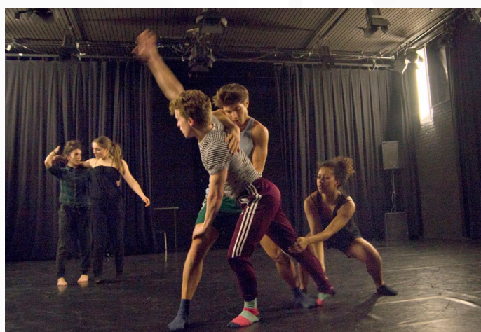
Black Box Dance Company residency på Bora Bora, 2014.