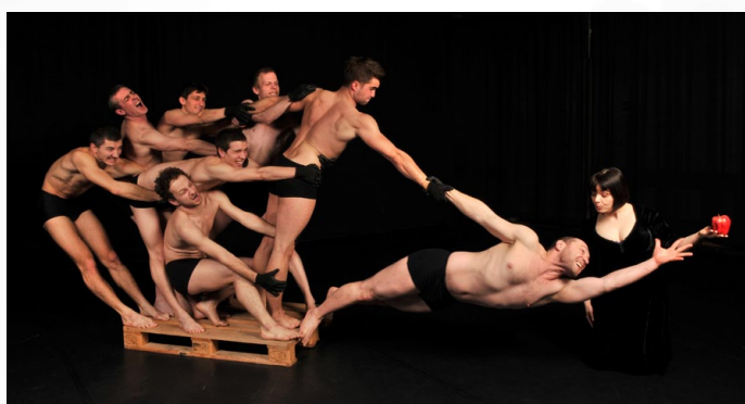
Granhøj Dans / Bora Bora - Men & Mahler, 2013.