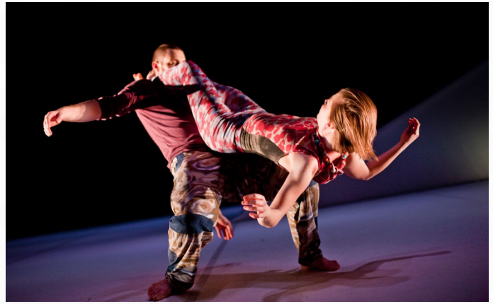
Recoil Performance Group, Living Room, forår 2014.