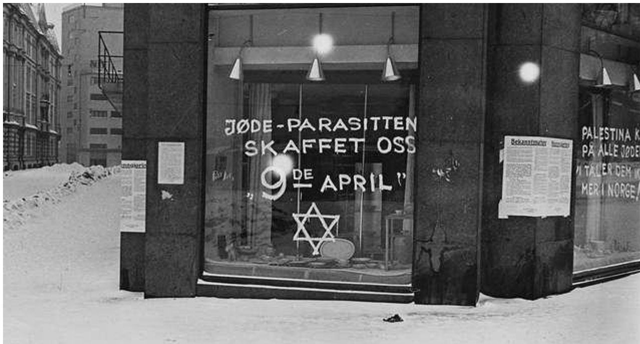
Antisemitisk grafitti i Oslo i 1941.