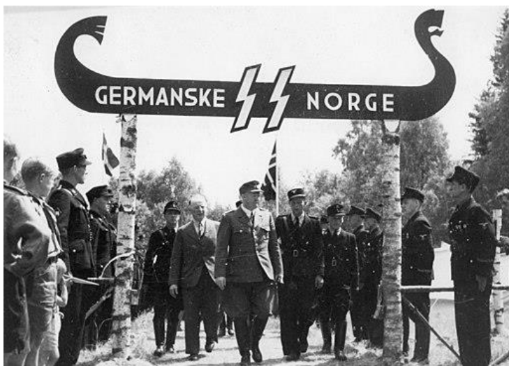
Vidkun Quisling ved Nasjonal Samlings 8. stævne i 1943.

Det er i den situation i Norge, hvor Tyskland har besat landet, og jøderne forfølges for at blive sendt til tyske koncentrationslejre, at de fire børn i filmen flygter mod grænsen til Sverige, som var neutralt under 2. verdenskrig og derfor kunne tage imod flygtninge.