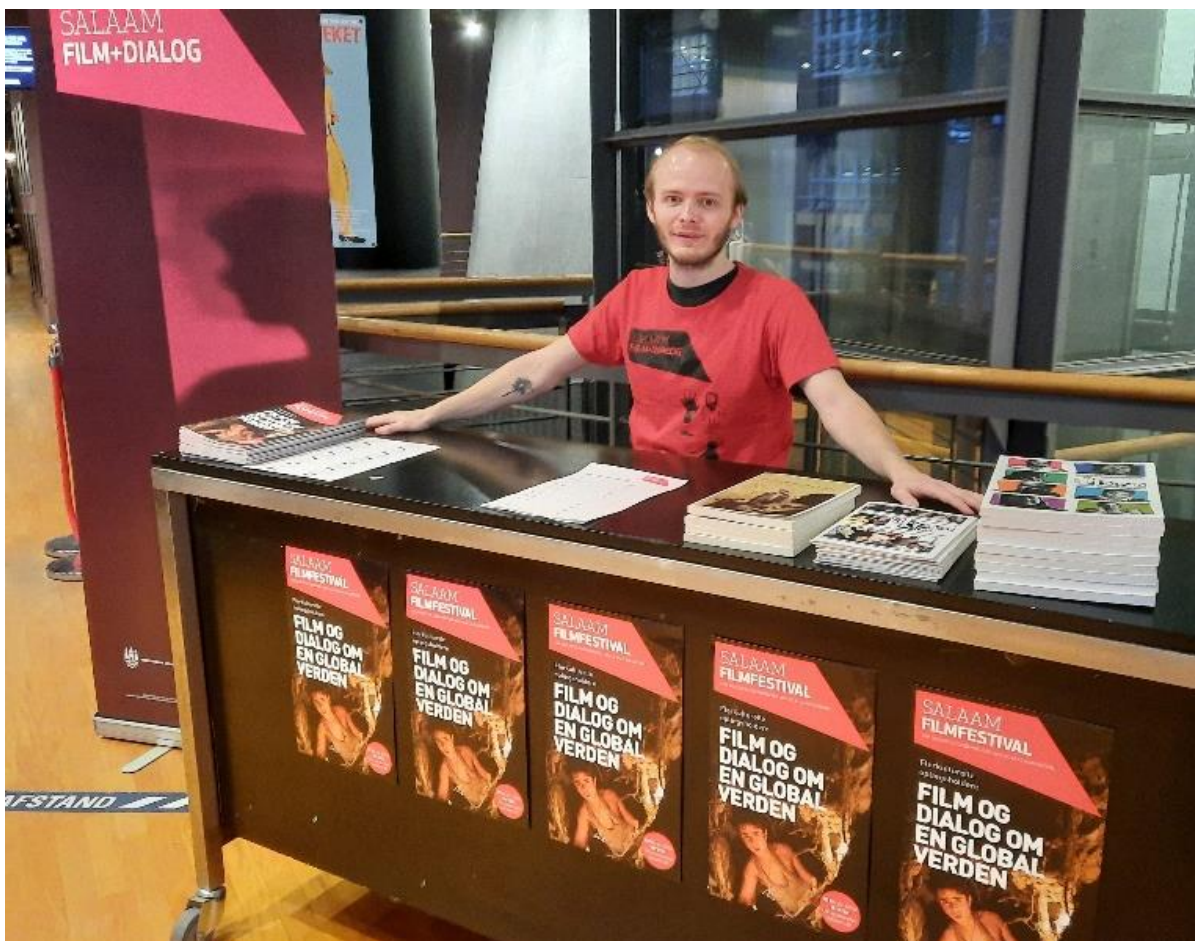
Salaam Filmfestival i Cinemateket i København

Med film fra alverdens lande og levende, personlige oplæg tilbyder Salaam et globalt udsyn og øget indsigt i verdens kulturer.