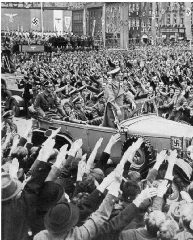
Hitler hyldes under et besøg i byen Eger i 1938.

I 1933 tog det nazistiske parti med Adolf Hitler i spidsen magten i Tyskland. Partiet havde en stærkt nationalistisk og racistisk ideologi. Det førte i første omgang til forfølgelse af jøder i Tyskland, hvor de ikke måtte være ansat i offentlige stillinger eller eje forretninger, og de skulle have en gul stjerne syet på tøjet, så man altid kunne se, hvem der var jøde.