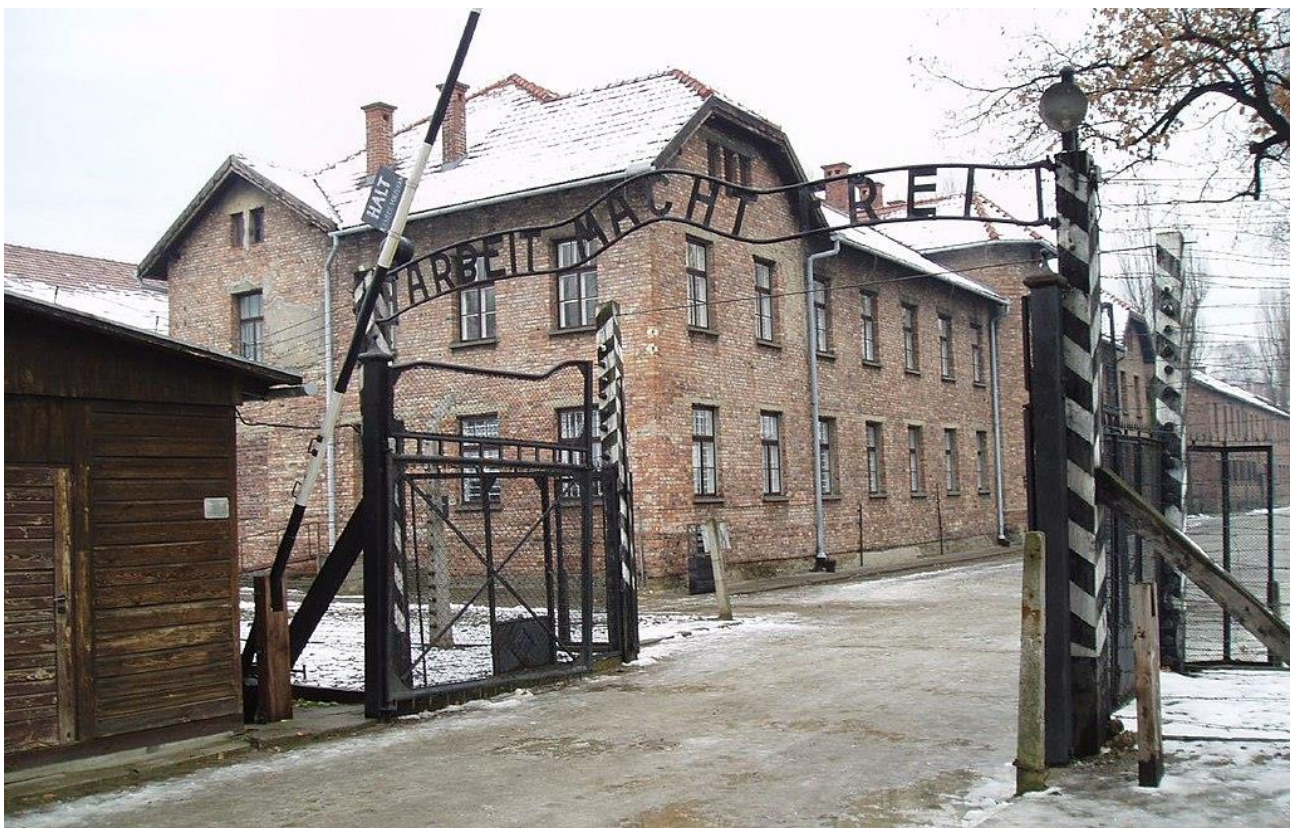
Indgangen til den berygtede nazistiske udryddelseslejr Auschwitz.

Information: Jøderne i Norge var en upopulær minoritet i 1942 https://www.information.dk/kultur/2018/12/joederne-norge-upopulaer-minoritet-1942